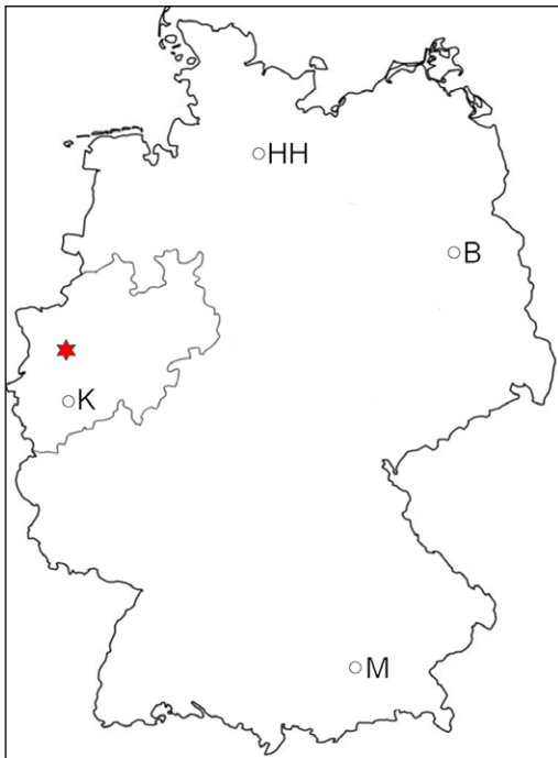
Abb. 1: Karte von Deutschland mit dem Umriss von Nordrhein-Westfalen und den größten Städten Berlin (B), Hamburg (HH), Köln (K) und München (M). Der Fundort in Mülheim an der Ruhr ist mit einem Stern gekennzeichnet.

Schildkrötenreste sind in den Schichten der unteren Oberkreide Deutschlands sehr selten. Die meisten Funde liegen aus Sedimenten des Turoniums vor (DIEDRICH & HIRAYAMA, 2003; KARL et al., 2012; SACHS et al., 2016; SACHS et al., im Druck). Aus dem Cenomanium wurde bisher nur ein Fund beschrieben, der sicher von einer Schildkröte stammt. Es handelt sich hierbei um einen Humerus aus dem Mittelcenomanium von Halle (Westfalen) (DIEDRICH, 1999). Ein artikulierter Schildkrötenrest (bestehend aus dem