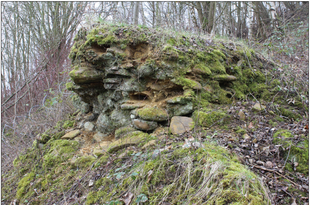
Abb. 2: Der sogenannte „Strandwall“ im Steinbruch Rauhen, hier etwa 1 m mächtig. Zustand März 2015.

Erste Beschreibungen und Interpretationen der Sedimententstehung stammen von KAHRs (1925, 1927) und FIEGE (1928a, b). Diese Darstellungen bildeten die Basis für jüngere Bearbeitungen (SCHEER & STOTTROP, 1995; KAPLAN et al., 1998). KAHRs (1925) beschrieb als erster die spezielle Lithologie des Untercenomaniums: Es handelt sich um ocker- bis fleischfarbene Kalksteine, zum Teil mit eingestreuten Glaukonit-Körnern und Phosphoritgeröllen, für die KAHRs (1925) den Begriff „Rotkalk“ prägte, der