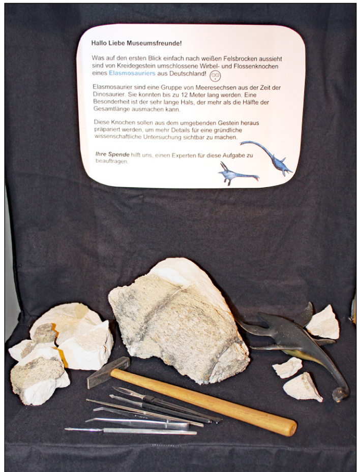
Abb. 1: Ausstellung der Exponate im Eingangsbereich des Naturkunde-Museums im Sommer 2016, um Spenden für die Präparation zu sammeln.

weitestgehend unpräpariert und konnten mithilfe von Spendengeldern (Abb. 1) im Herbst 2016 durch Paul Freitag aus Rostock fachgerecht nachpräpariert werden. In einem populärwissenschaftlichen Artikel stellte LADWIG (1997) die Fossilien bereits vor, sprach sie aber als Mosasaurierreste an. Weitere Teile des gleichen Individuums (siehe Fundgeschichte) wurden bereits von MAISCH & SPAETH (2004) beschrieben. Sie befinden sich in der Sammlung des Instituts für Geologie der Universität Hamburg sowie in mehreren Privatsammlungen und umfassen einen Zahn, Cervical-, Dorsal- und Caudalwirbel, Teile der Gliedmaßen sowie 110 Gastrolithen.