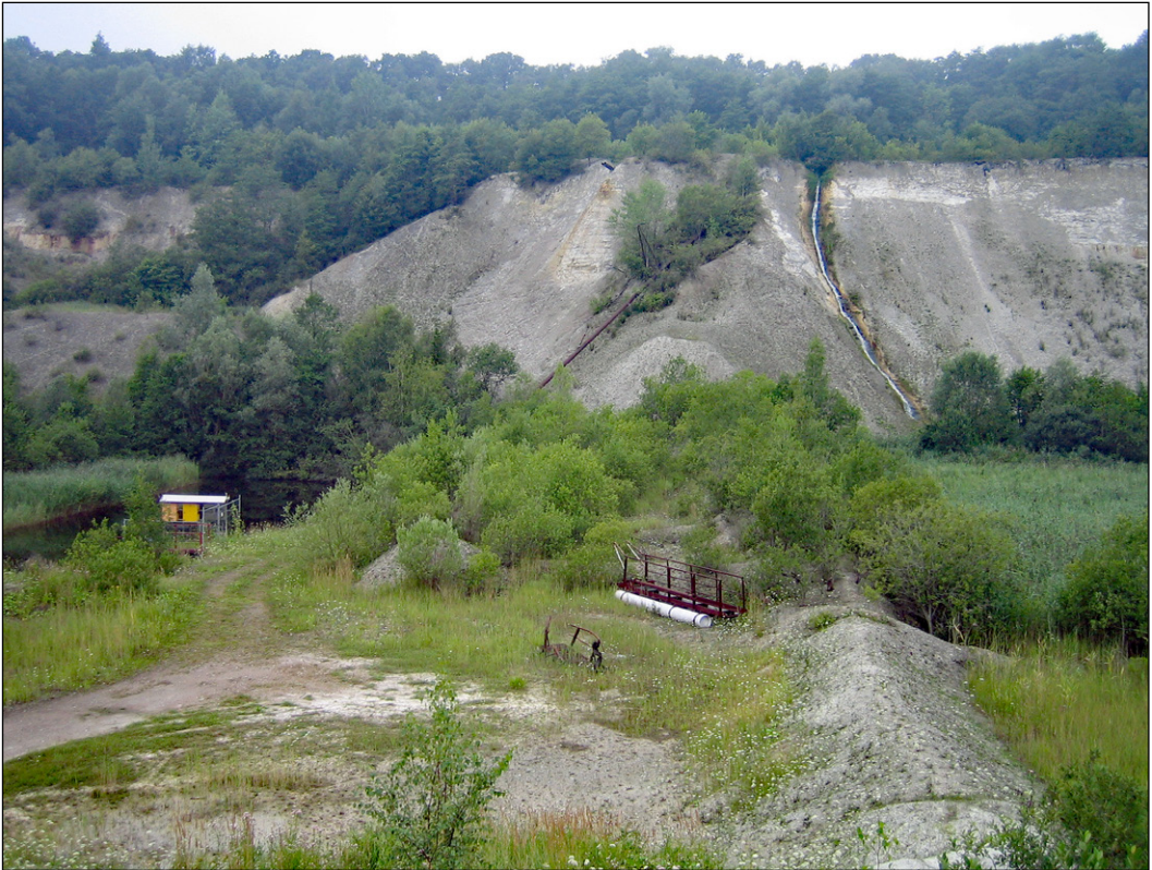
Abb. 2: Blick auf die Fundstelle an der Westwand der Grube „Saturn“. Die Elasmosaurierreste lagen auf mittlerer Höhe des Hangs, rechts neben den Büschen (jetzt von Hangschutt bedeckt).