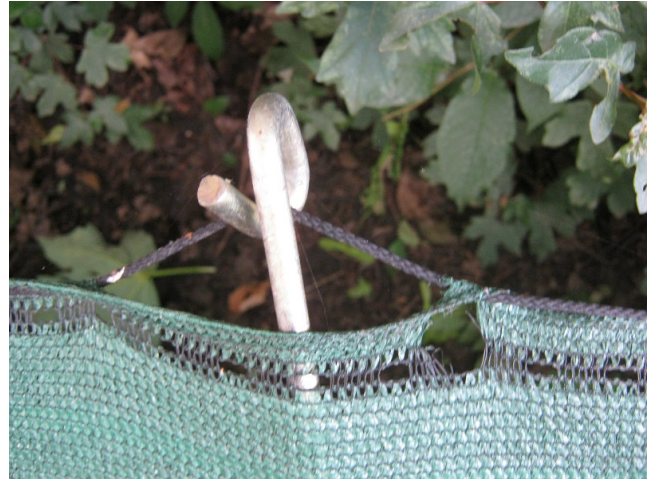
Haltestab aus 2018 Ab Einschlagstelle ca. 55 cm hoch