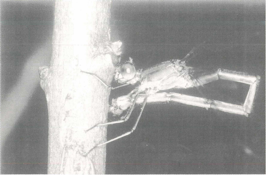
Weidenjungfer ♀ bei der Eiablage ( Chalcolestes viridis )