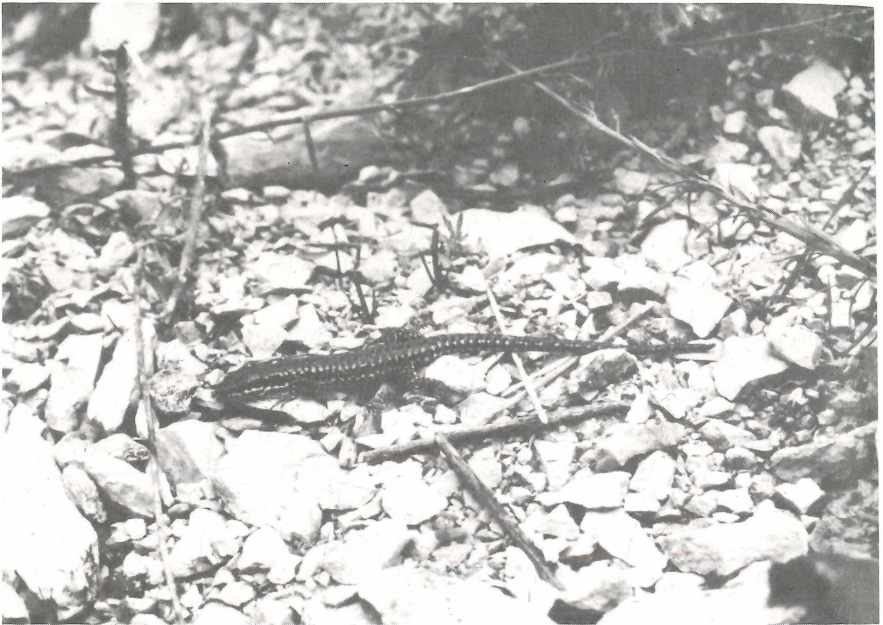
Abb. 1: Männliche Mauereidechse ( Podarcis muralis ) am Ostwestfalen-Damm in Bielefeld

Während entomologischer Untersuchungen (RATHJEN, dieser Band) an einem sonnenexponierten Kalkhang an der B 61 (Ostwestfalen-Damm) (MTB 3917/3) im Stadtgebiet Bielefelds wurden ab Juni immer wieder Mauereidechsen beobachtet. Da der nächste natürliche Standort der Art bei Bonn liegt, kann es sich bei den Bielefelder Tieren nur um gezielt ausgesetzte und angesiedelte Individuen handeln. Tiere unterschiedlicher Größe (Subadulte, Adulte) konnten bis Anfang September beobachtet werden. Ob in 1996, einem Jahr mit durchschnittlichen Temperaturen, auch eine Reproduktion stattgefunden hat, konnte nicht nachgewiesen werden.