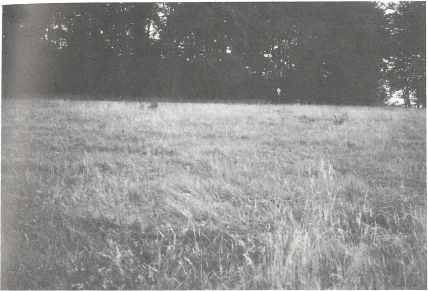
Abb. 4: Nordhang-Wiesenbiotop der Wespenspinne (Richtung Süden)