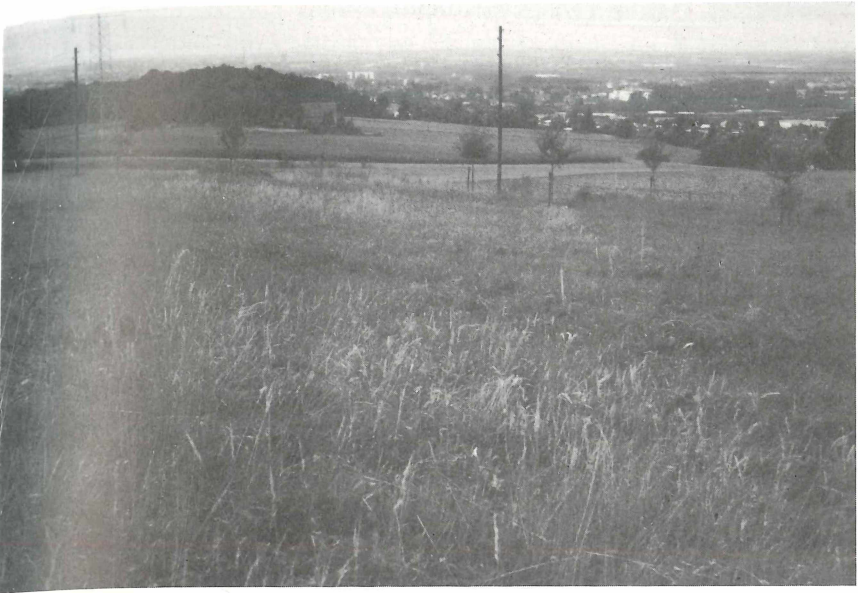
Abb. 3: Nordhang-Wiesenbiotop der Wespenspinne (Richtung Nord- westen)