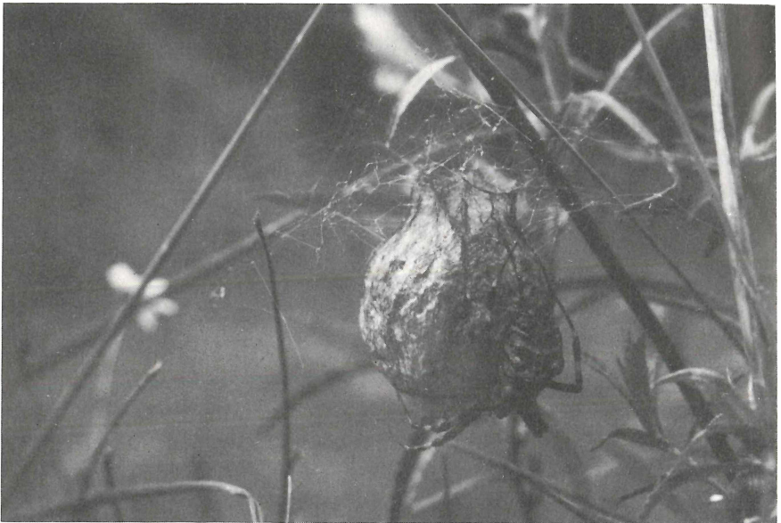
Abb. 2: Krugförmiger Eikokon mit Schutzgewebe und erschöpftem ♀ während der „Bewachungsphase“