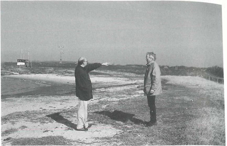
Vorexkursion nach Spiekeroog (April 1999) zur Vorbereitung einer Lehrerfortbildung. "Da geht es lang!"