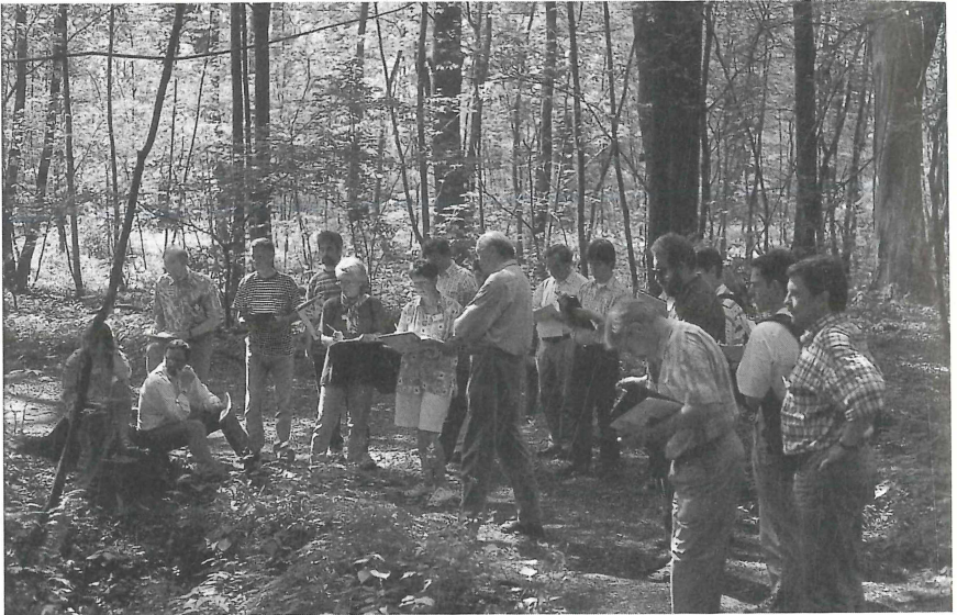
"Frühling im Auwald" - Lehrerfortbildung an der Heerser Mühle im Juni 1998