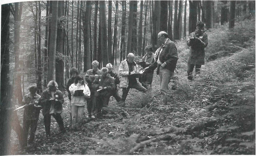
Mit diesem Bild (Lehrerfortbildung im Eggegebirge mit Kollegen aus Brandenburg im Mai 1994) wurde "er" in ganz Deutschland bekannt (P.d.NW.Bio 8/48, 1999 - Waldheft)