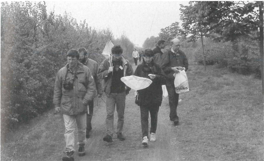
Lehrerfortbildung "Insekten" (Mai 1996) am Heiligen Meer ... man denke an die zahlreichen Käfer in den zahlreichen Döschen in den zahlreichen Taschen .... Nicht alle Biologen sind so harmlos wie "er"