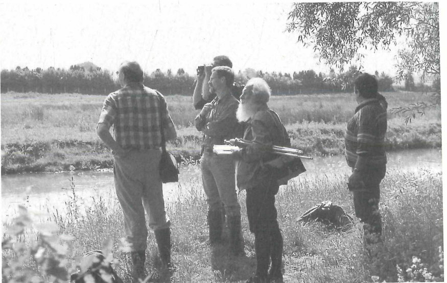
Exkursion im Juni 1999: "An der Heder bei Upsprunge mit Blick auf die Salzwiesen begann sie .....