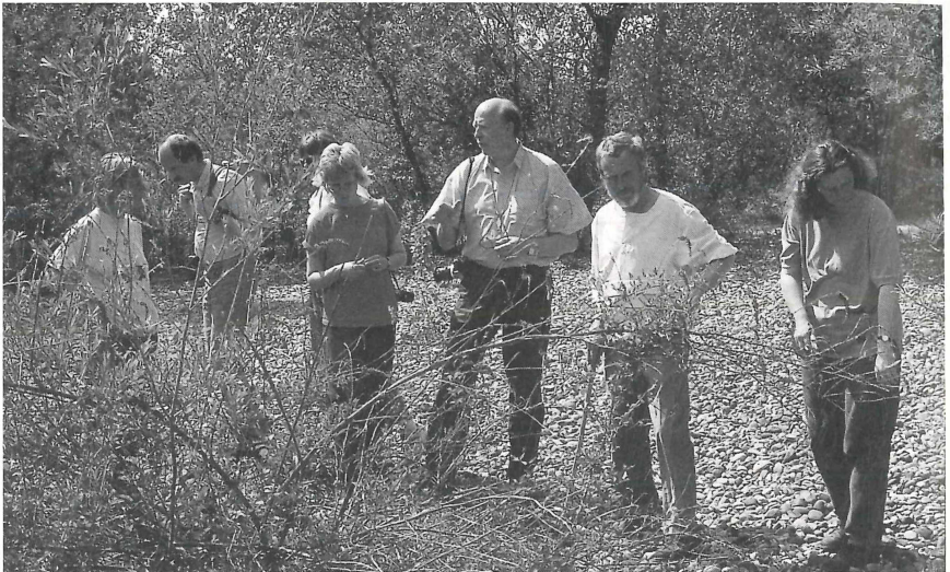
Juni 1991: Lehrerfortbildung am Kaiserstuhl Erläuterungen am Rheinufer bei Marckholzheim zum Sanddorn-Lavendelweiden-Busch

Nach der Namensklärung und den mehr faunistischen Hinweisen will ich nun endlich zu den versprochenen Bildern kommen.