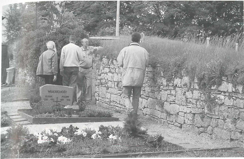
.... an der alten Friedhofsmauer in Obermarsberg endete sie!"