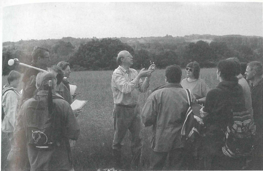
Lehrerfortbildung "Grünland" am Doberg bei Bünde (Juni 1998)