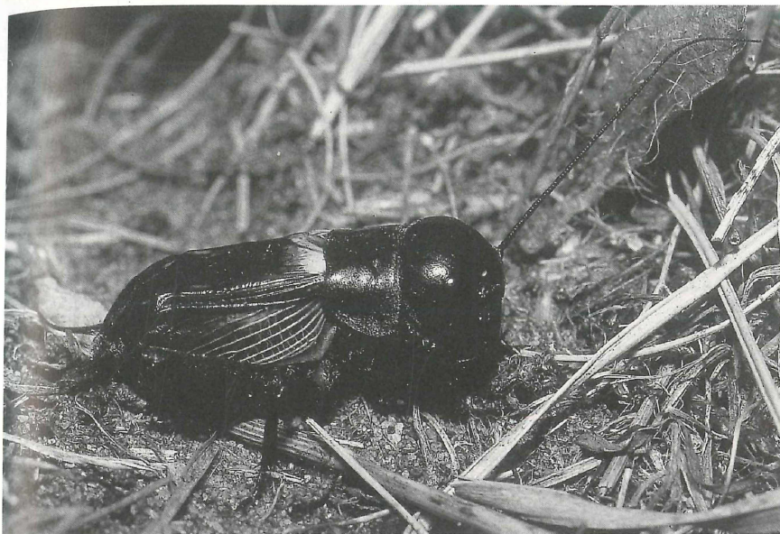
Abb. 2: Männliche Feldgrille (Imago) (C. Venne)