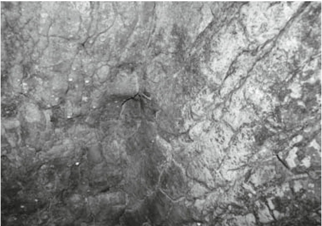
Abb. 2: Kolk in der Decke am Höhleneingang