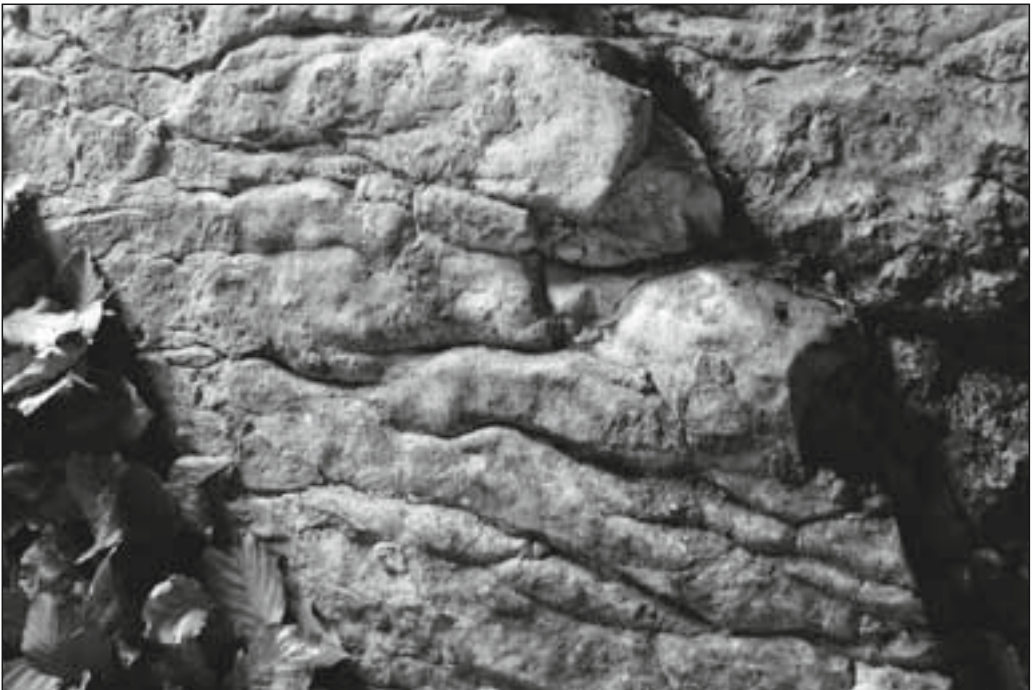
Abb. 3: Durch korrosives Wasser gerundete Gesteinskanten