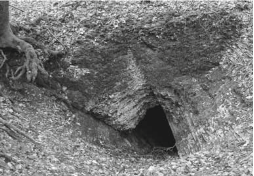
Abb. 1: Höhleneingang, rechts davon dünne Kalkschichten, links oben eine dickere Schicht mit Querplattung.

brand nahelegt, entstanden ist, stellt sich die Frage wie dann? Die weitaus meisten Höhlen sind dadurch entstanden, dass kohlenstoffhaltiges Wasser durch feine Risse (Schichtfugen und Klüfte) in Kalkstein eindrang und dort Kalk auflöste. Dadurch wurden die Risse weiter, es konnte mehr Wasser eindringen und mehr Kalk gelöst werden, bis schließlich eine Höhle (Karsthöhle) entstand. Kalkstein ist im Bereich der Zwergenhöhle vorhanden, Klüfte hat er seit der Auffaltung des Teutoburger Waldes. Wenn es genügend Wasser gegeben hat, hat das auch genügend Kohlendioxid aufnehmen können, entweder schon als Regentropfen aus der Atmosphäre oder noch besser beim Versickern in humosem Boden, wo durch biologische Abbauvorgänge die Bodenluft wesentlich mehr \text{CO}_2 enthält als die Atmosphäre. Wo aber das Wasser in ausreichender Menge