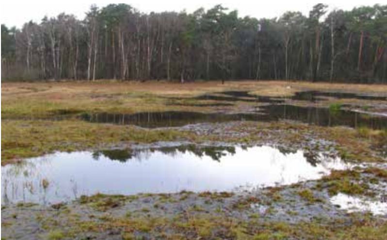
Abb. 5: Beginnende Vegetationsentwicklung auf den abgeschobenen Flächen im Osten des „Schnakenpohls“.