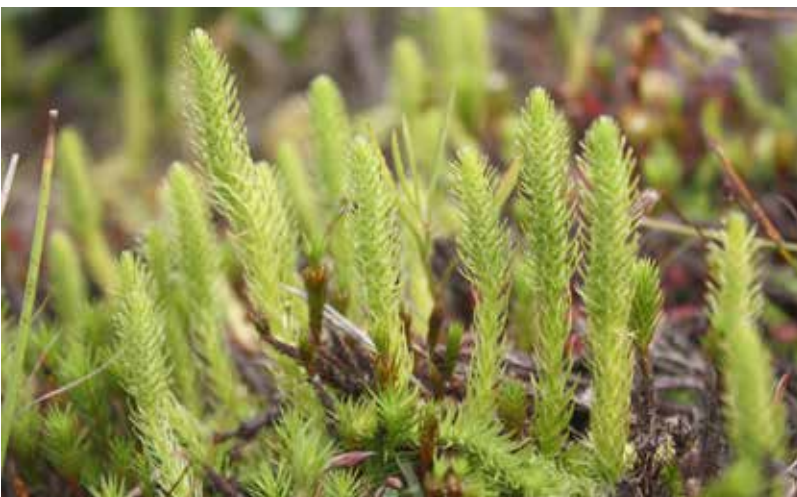
Abb. 9: Sumpf-Bärlapp ( Lycopodiella inundata ).