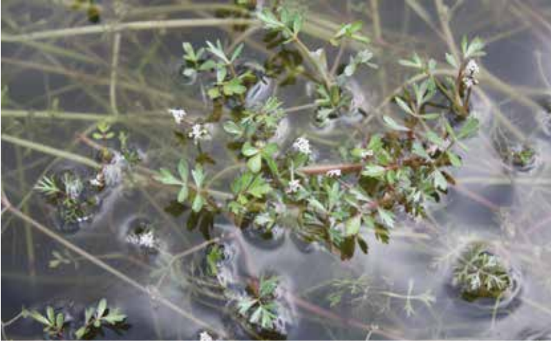
Abb. 7: Flutender Sellerie ( Helosciadium inundatum ).