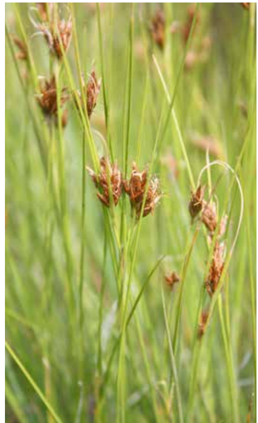
Abb. 11: Braunes Schnabelried ( Rhynchospora fusca ).

Eine Gefahr für Heideweier allgemein ist schließlich eine übermäßige Versauerung der Gewässer. Der „Schnakenpohl“ ist zur Zeit als „relativ sauer“ einzustufen, aber in einem bisher akzeptablen Rahmen. Dieser Aspekt muss im Auge behalten werden, ist hier allerdings auch nicht einfach zu beeinflussen.