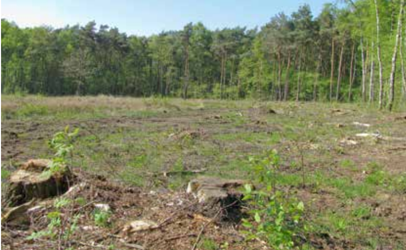
Abb. 3: Gehölzentfernung auf der Ostseite des „Schnakenpohls“. Foto: D. Diesing (2009)