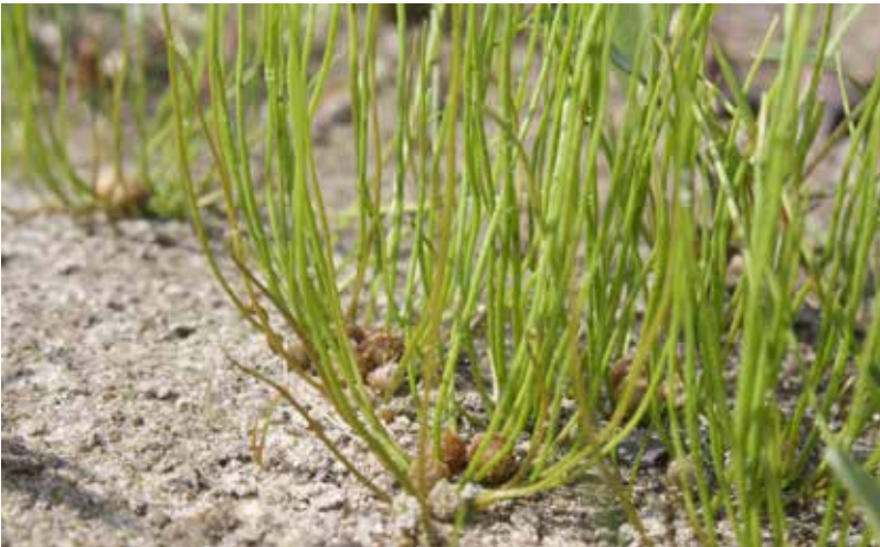
Abb. 8: Pillenfarn ( Pilularia globulifera ).