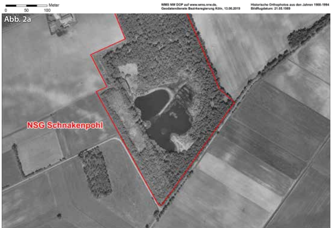
Abb. 2a–c: Luftbildaufnahmen des „Schnakenpohls“ und des unmittelbaren Umfeldes aus den Jahren 1989 (a), 2000 (b) und 2017 (c), die die Entwicklung des Gebietes verdeutlichen ( 2a: WMS NW DOP auf www.wms.nrw.de , Geodatendienste Bezirksregierung Köln, 13.06.2019, Historische Orthophotos aus den Jahren 1988-1994, Bildflugdatum: 21.05.1989; 2b (rechte Seite oben): WMS NW HIST DOP auf www.wms.nrw.de , Geodatendienste Bezirksregierung Köln, 20.03.2020, RGB-/Colorbild – Normale farbliche Darstellung, Bildflugdatum: 09.06.2000; 2c (rechte Seite unten): WMS NW DOP auf www.wms.nrw.de , Geodatendienste Bezirksregierung Köln, 13.06.2019, RGB-/Colorbild – Normale farbliche Darstellung, Bildflugdatum: 27.05.2017)

Dringende Hinweise auf die weit fortgeschrittene Verbuschung der Gewässerufer und das fortschreitende Verschwinden seltener Pflanzenarten blieben Anfang der 1990er Jahre zunächst ohne Reaktion. Der