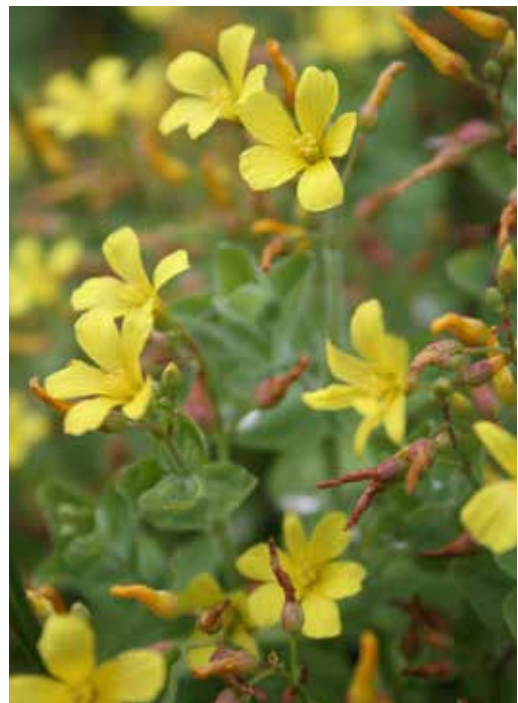
Abb. 6: Sumpf-Johanniskraut ( Hypericum elodes ).

Viele bemerkenswerte Pflanzenarten (im Gebiet ist bewusst nichts eingebracht worden!), die im Gebiet schon lange nicht mehr gefunden wurden, sind erstaunlich schnell wieder aufgetreten (vgl. Tab. 1) und haben teilweise in kurzer Zeit bereits große Populationen aufgebaut. So bildet z. B. der Mittlere Sonnentau ( Drosera intermedia ) inzwischen bereits Bestände von mehreren 10.000 Exemplaren, sodass auch das Samendepot im Boden wieder ausreichend aufgefüllt sein dürfte. Besonders erfreulich ist, dass auch der Flutende Sellerie ( Helosciadium inundatum ) und die Flutende Moorbinse ( Isolepis fluitans ) wieder aufgetreten sind, die hier derzeit ihre einzigen bekannten Wuchsorte im Kreis Minden-Lübbecke haben. Man kann davon ausgehen, dass von den meisten dieser Arten noch keimfähige Diasporen im Boden vorhanden waren. Nur in Einzelfällen, z. B. bei Geflecktem Knabenkraut ( Dactylorhiza maculata ), Rippenfarn ( Blechnum spicant )