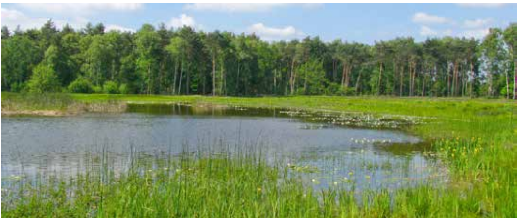
Abb. 1: Blick über einen Teil des „Schnakenpohls“.

Keywords: Westphalia, nature reserve, heathland pond, seed bank, flora, care measures