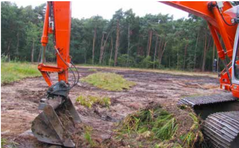
Abb. 4: Flaches „Abschieben“ von Flächen mit einem Bagger.